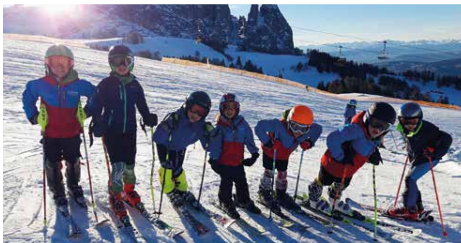
VSS Kinder auf der Seiseralm