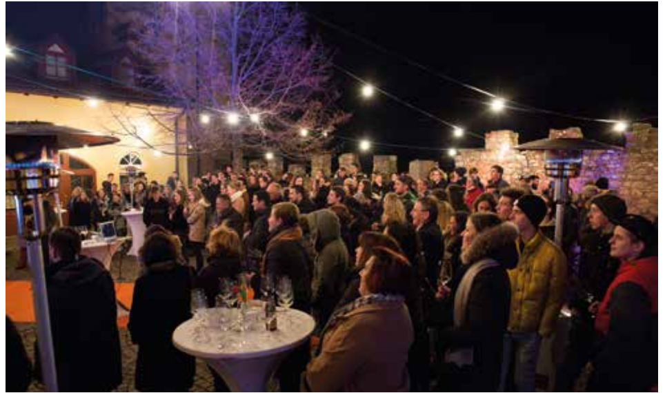
Die Jungbürgerfeier im Schloss Rechenthal war ein voller Erfolg.

Die Jungbürgerfeier war ein voller Erfolg. Eine zweite Auflage für den Jahrgang 2002 wird aller Voraussicht nach im nächsten Jahr wieder stattfinden.