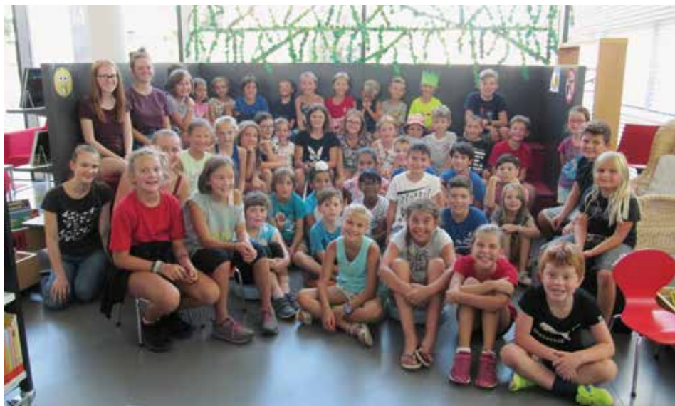
Großes Abschlussfest der Sommerleseaktion 2019.

Der besucherstärkste Tag war weiterhin der Dienstag, und da kann es dann auch mal recht turbulent und laut werden. Selten gingen unsere BesucherInnen mit leeren Händen nach Hause, durchschnittlich gingen täglich 126 Medien über die Theke. 924 Menschen haben