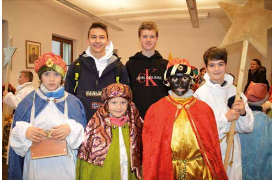
Eine Sternsingergruppe vor dem Start: es wird ein langer Tag, macht aber auch Spaß!

Mit den Spenden werden weltweit über 100 Hilfsprojekte im sozialen, pastoralen und bildenden Bereich unterstützt. Eines davon ist heuer die Schule in Puerto Murialdo, ein anderes die Sonderschule für Kinder mit Beeinträchtigung in der Stadt Tena in Equador. hgk