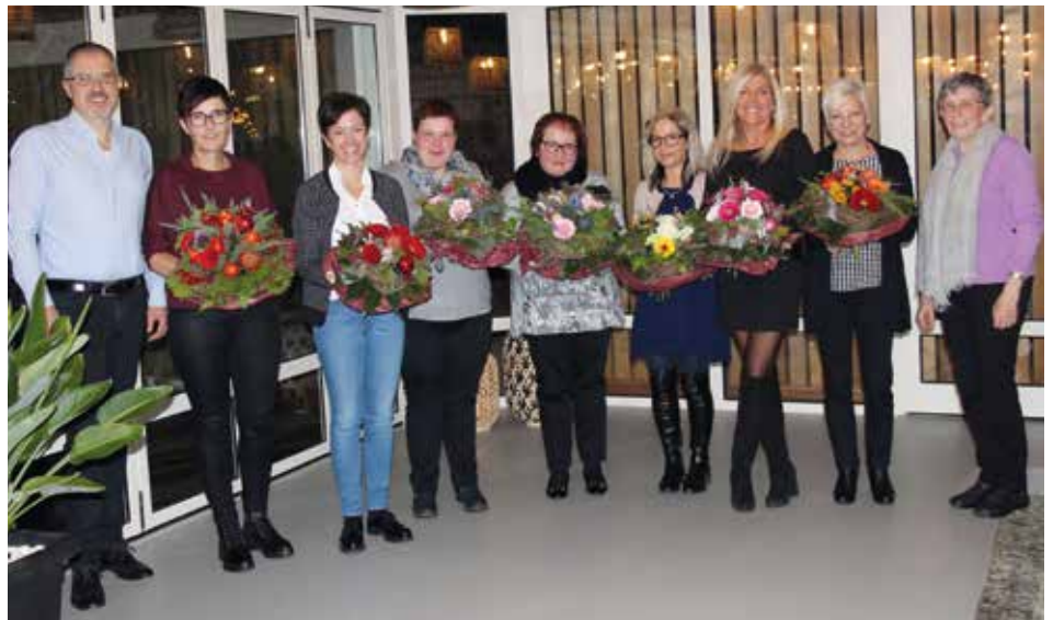
Tabelle: Tagessatz 2020 Alten- und Pflegeheim St. Anna

Sie basiert auf einer empathischen Arbeitshaltung und einem ganzheitlichen Ansatz zur Erfassung des Patienten. Diese Arbeits- und Kommunikationsmethode Validation wird im Alten- und Pflegeheim St. Anna seit einiger