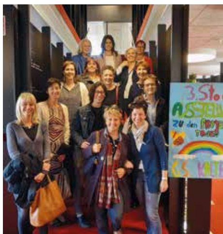
Die ehrenamtlichen Mitarbeiterinnen bei der Besichtigung der neuen Bibliothek Kaltern.

2019 mindestens 1 Medium ausgeliehen! Außer der Ausleihe an Medien waren auch die vielfältigen Veranstaltungen gut besucht. Mit 73 Veranstaltungen und Bibliothekseinführungen bot die Bibliothek einen ganzen Reigen an unterschiedlichen Angeboten.