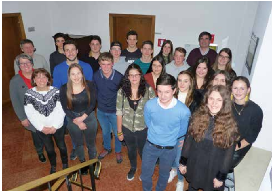
„18 Jahre geschenktes Leben!“ Dazu gratulierten der Bürgermeister, der Pfarrer (nicht im Bild) und die Gemeindeferenten den Traminer Jugendlichen des Jahrganges 2001 bei einem kurzen Zusammentreffen im Rathaus zum Auftakt der Jungbürgerfeier im Schloss Rechtenthal.

Um das Programm im Außenbereich kümmerte sich das Jugend- und Kulturzentrum Point Neumarkt. Aus ihrem umgebauten Wohnwa-