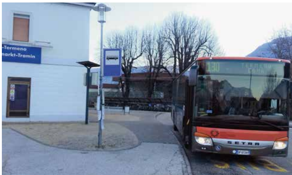
Mit dem Bus zum Neumarkter Bahnhof und von dort mit dem Zug bequem und rasch nach Bozen oder – erstmals möglich - auch nach Trient. hgk

Infos unter: 840000471 oder www.suedtirolmobil.info oder Fahrpläne